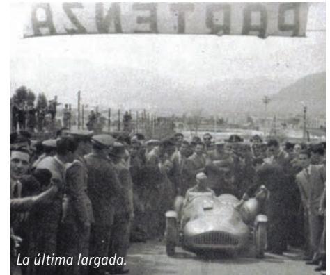
La última largada.

Con el número 11:46 en sus laterales, y sin acompañante, precisamente a esa hora del 10 de abril largó Nuvolari con el Abarth 204 A, recorriendo ese trabado camino en subida en 6 minutos 21 segundos 7/10, a una