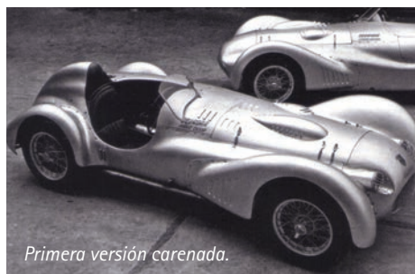
Primera versión carenada.

Luego de este exitoso debut, Dusio organizó una carrera exhibición monomarca en Egipto, y además los autos participaron en diversas carreras, que sirvieron para el surgimiento de jóvenes figuras como Alberto Ascari.