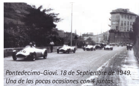
Pontedecimo-Giovi. 18 de Septiembre de 1949. Una de las pocas ocasiones con 4 juntas.

Si bien hay registros de chasis hasta el número 08, por los antecedentes deportivos de cada uno, y por el hecho que solamente se trajeron 5 suspensiones delanteras, podemos afirmar que solamente se construyeron