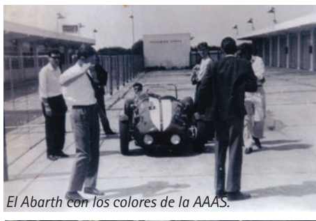
El Abarth con los colores de la AAAS.

El 27 de junio de 1966, es adquirido por la Asociación Argentina de Automóviles Sport (AAAS) en 280.000 pesos según Acta N° 17, donde es utilizado hasta mayo de 1969 en que es vendido, como auto de entrenamien-