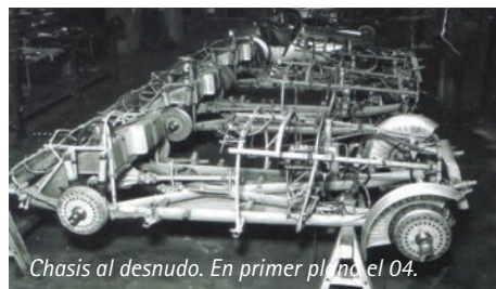
Chasis al desnudo. En primer plano el 04.

Dusio, y es precisamente aquella donde Tazio Nuvolari pierde el volante de dirección (ver nota en esta misma edición).