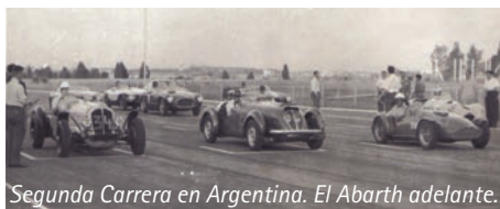
Segunda Carrera en Argentina. El Abarth adelante.

Super Sport 1100, y destacando su "chasis tubular, suspensiones tipo Porsche, línea moderna, velocidad 160 Km/h, excelente cabina de pilotaje y un peso de 550 kg."