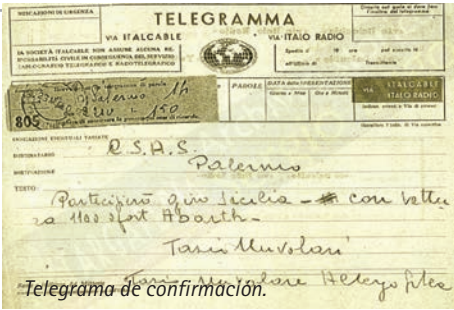
Telegrama de confirmación.

Además Nuvolari colaboró en una importante campaña publicitaria para difundir el "Comando Cambio al Volante Abarth" cuya publicidad es una imagen de Tazio sentado al volante de una Fiat Giardiniera mostrando esta transformación mecánica.