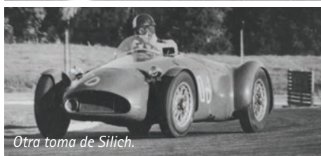
Otra toma de Silich.