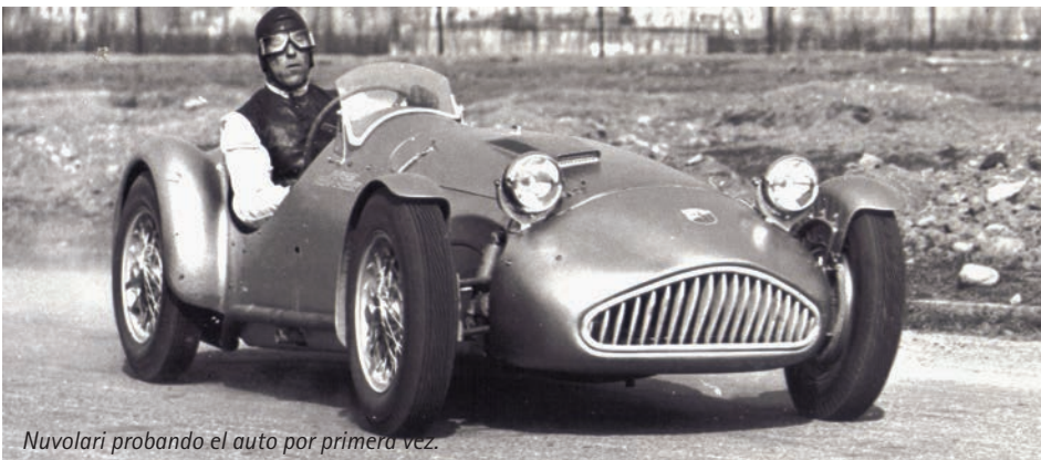
Nuvolari probando el auto por primera vez.